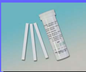
CZD LL 10