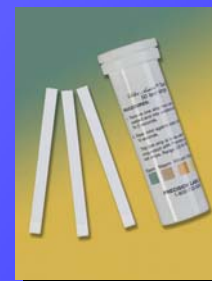
CZD CHLOR 200