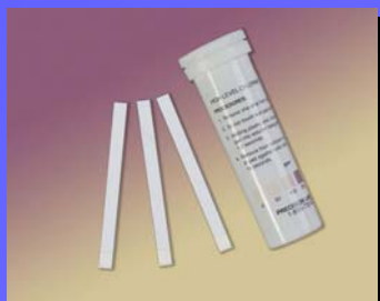
CZD HL 1000