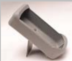
Protección de goma