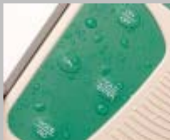
Teclado táctil resistente al agua