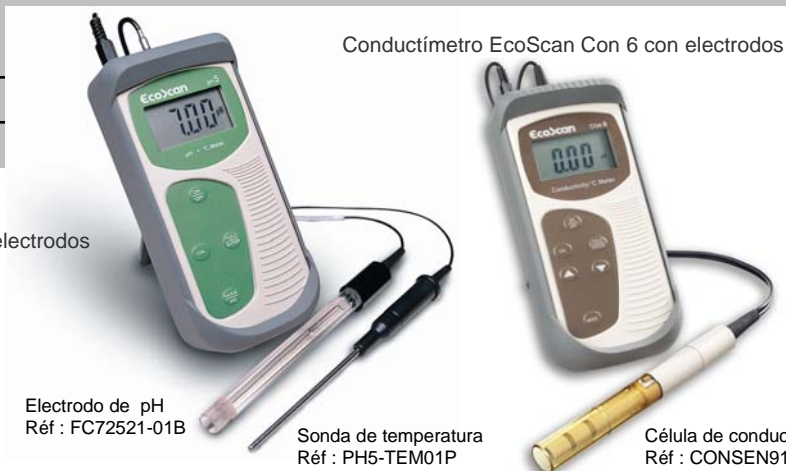
Conductímetro EcoScan Con 6 con electrodos