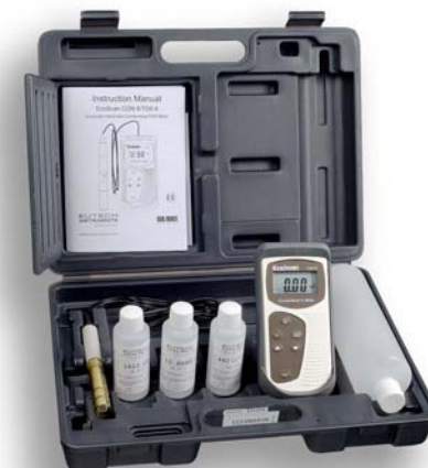
Electrode Conductivité Réf : CONSEN91B