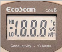
Large écran LCD